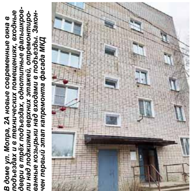
В доме ул. Мопра, 2А новые современные окна в подъездах и в технических помещениях, входные двери в трёх подъездах, односпальные фальшкровли над лоджиями верхних этажей, отремонтированные козырьки над входами в подъезды. Закончен первый этап капремонта фасада МКД

Александр Севрюгин зам. начальника ПТО