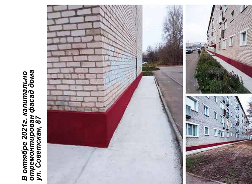
В октябре 2021г. капитально отремонтирован фасад дома ул. Советская, 87