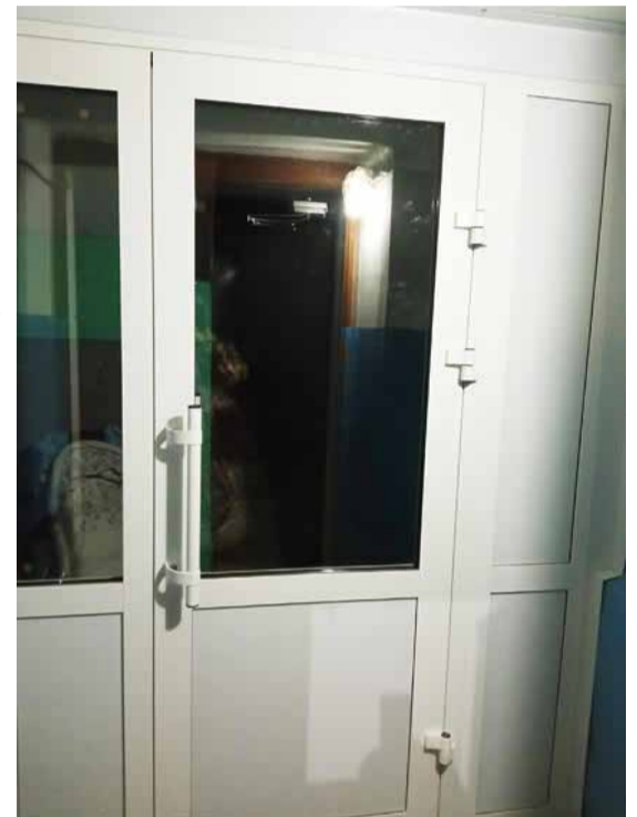
Ул. Советская, 56. Замена входных дверей в подъездах с 1 по 4

В этих обстоятельствах жители спрашивают совета, как поступить, чтобы деньги на спецсчете не обесценились раньше, чем удастся собрать нужную сумму. Разумеется, можно проводить ремонт частями, от элемента к элементу, сейчас это разрешено. Например, сначала восстановить межпанельные швы, через годик заменить окна в подъездах, ещё через год поставить новые двери, потом привести в порядок водостоки и потихоньку копить на замену подъездных козырьков. Кто-то